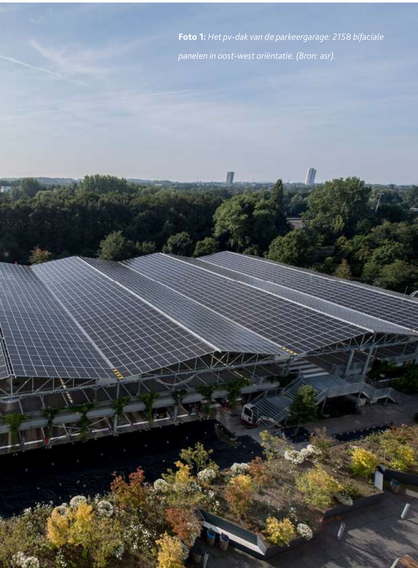
Foto 1: Het pv-dak van de parkeergarage: 2158 bifaciale panelen in oost-west oriëntatie. (Bron: asr).

Er is veel gebeurd de afgelopen tien jaar bij asr. De verzekeraar sloot een zestal kantoren in het land en concentreerde zijn werkzaamheden in het kantoor in Utrecht. In 2016 werd een grootscheepse renovatie afgerond, dat er destijds toe leidde dat het 84.000 m 2 BVO tellende kantoor een energielabel A++ haalde. “We zijn gegaan van een elektriciteitsgebruik van 30 miljoen kWh in 1970 naar 5 miljoen kWh in 2020”, zegt Ruijter, terwijl hij op zijn laptop een indrukwekkend dalende lijn in een grafiekje laat zien. “Nu halen we met 48 kWh/m 2 /j met gemak Paris Proof – volgens de oude richtlijn van maximaal 48 kWh/m 2 /j. Recent is die soepeler geworden - 70 kWh/m 2 /j. En dan hebben we de opbrengst van het zonnedak van de parkeergarage nog niet eens meegenomen in de berekening.”