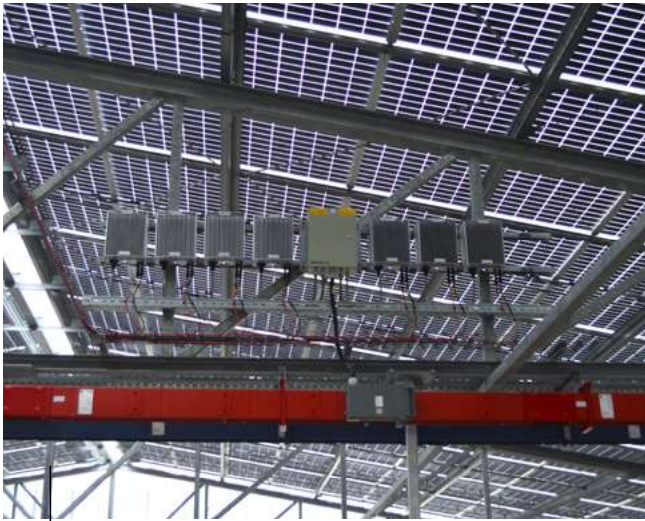
Foto 4: Optimisers van FerroAmp brengen de gelijkstroom die afkomstig is van de pv-panelen naar een spanningsniveau van 760 V.

Dat betekende dat vanaf dat moment het pand helemaal gasloos was. Om de capaciteit van de elektriciteitsaansluiting hoefde asr zich geen zorgen te maken. Het pand is aangesloten op 10 kV hoogspanning, met in totaal negen trafo's van 1000 kVA. Ruijter: "Ook voor de 450 laadpalen die we gaan installeren hebben we voldoende capaciteit, juist omdat het elektriciteitsverbruik van het gebouw zelf de afgelopen jaren zo is gedaald."