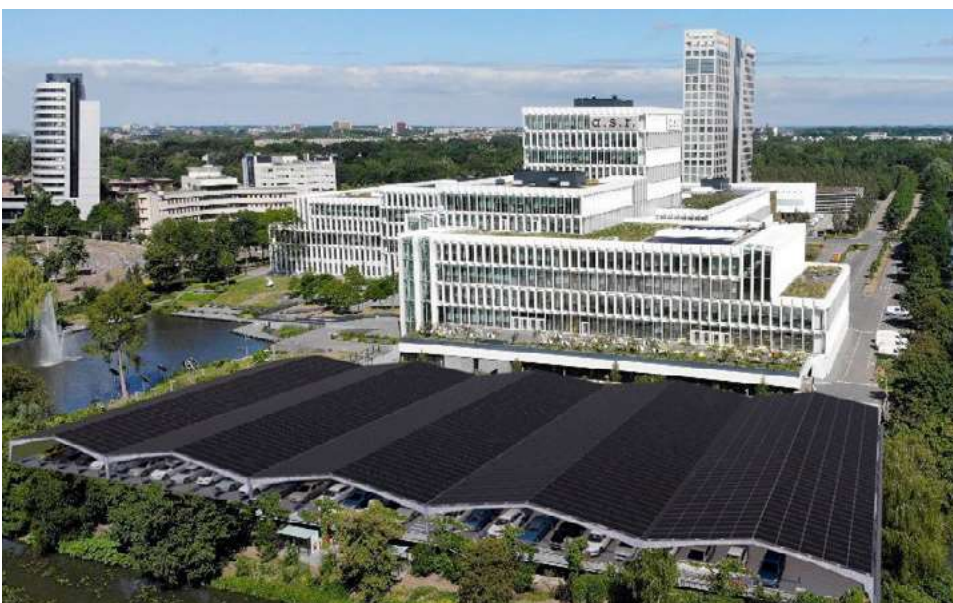
Foto 5: Het van 2013 tot 2015 gerenoveerde kantoor van asr in Utrecht. Deze oorspronkelijk uit de jaren '70 afkomstige kantoorcomplex, is met een gebruik van 48 kWh/m 2 /j nu Paris Proof.

Buiten dat gelijkstroom dus een stuk efficiënter is en minder grondstoffen nodig heeft, kan je met gelijkstroom ook veel beter, of autonomer, sturen, zegt De Bont. "Je stuurt op spanningsniveau –