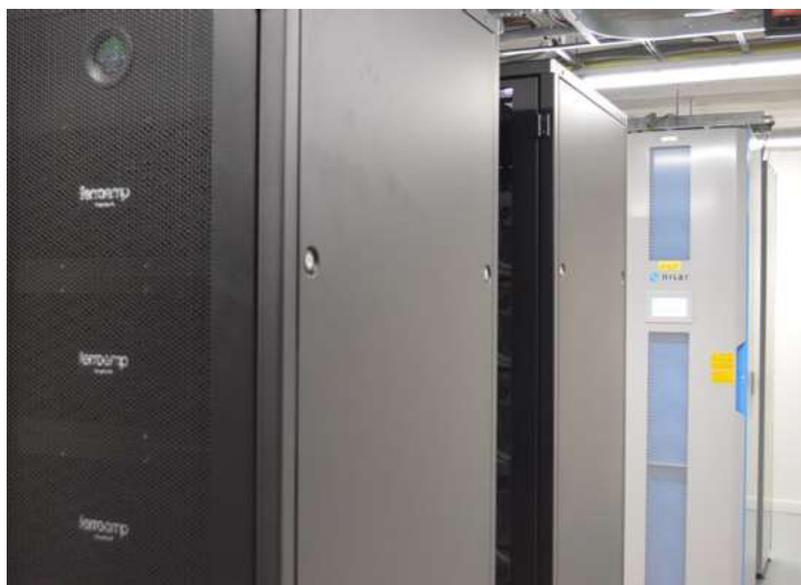
Foto 6: Op de voorgrond DC/AC omvormers van FerroAmp, op de achtergrond accu's van Nilar.

Hiervoor heeft Kropman software ontwikkeld, waarin in één integraal systeem zowel het gebouw met zijn HVAC, en ook pv-opwekking en laadprocessen minimaal 48 uur vooruit voorspeld worden. Ruijter: "Als je als medewerker echter aangeeft dat je per se wilt dat je auto binnen het uur is opgeladen, omdat je dan weer naar een klant toe moet, kan je in bijvoorbeeld een app prioriteit aanvragen." Onderdeel van slim laden kan ook zijn 'slim ontladen', waarbij de batterij van de elektrische auto's kan ontladen op momenten dat het kantoorgebouw elektriciteit nodig heeft. Bidirectioneel, zo wordt die techniek genoemd, die staat beschreven in de internationale norm ISO 15118-20.